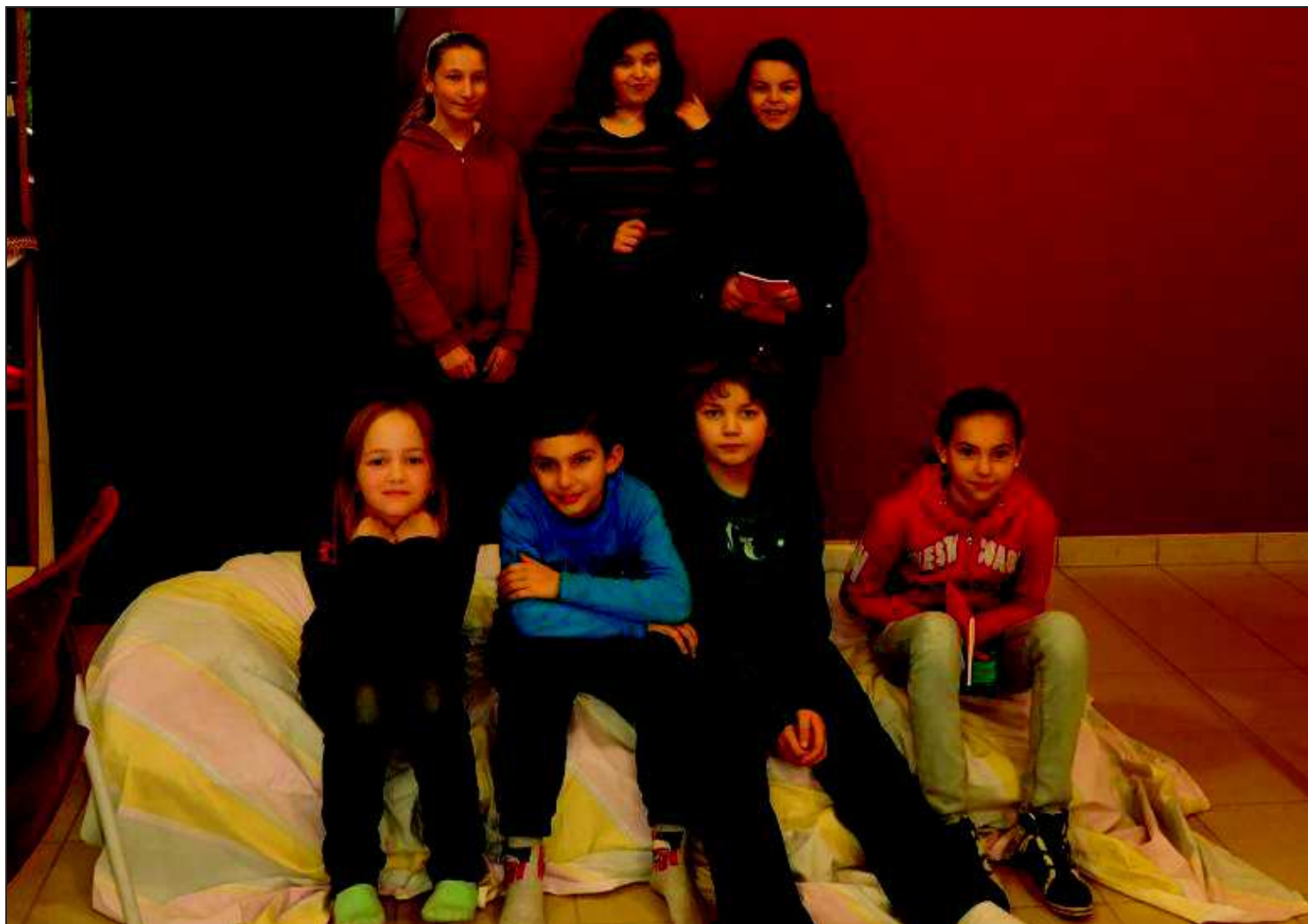
■ Les jeunes acteurs en répétition.

Théâtre « La mère Noël » à Pusey mardi après-midi.