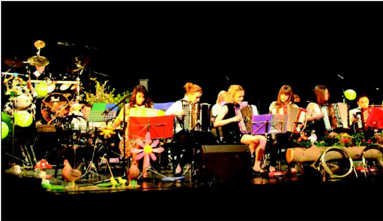
■ Les élèves de l'école lors d'une précédente représentation.