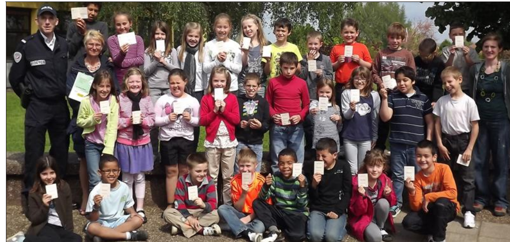
Remise des permis aux jeunes piétons à l'école Jules-Valès où la sécurité est une affaire très sérieuse.