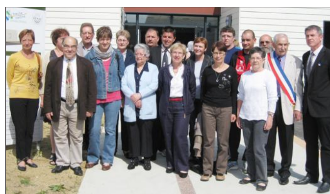
Les représentants des associations devant leur nouvelle maison.

Cet équipement d'un coût d'environ 800 000 € HT a reçu le soutien financier de l'État avec la DETR, du Conseil gé-