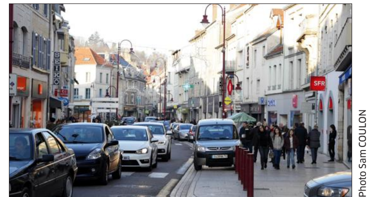
■ Via son site internet, le groupe d'opposition municipale « Vesoul, autrement ! » veut contribuer à l'amélioration du quotidien.

Pesmes Le distributeur de billets soufflé par une explosion