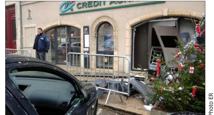
■ Une bande de malfaiteurs s'est attaquée au DAB du Crédit Agricole dans la nuit de mercredi à jeudi.

Plancher-Bas Chapuis : les salariés ne seront fixés que mi-janvier