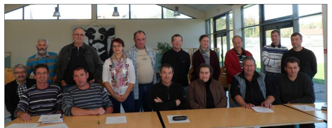
Les maîtres de stage du secteur agricole de se retrouver afin d'échanger sur la sécurité en exploitation

Avant de clôturer cette rencontre par un déjeuner, il a été présenté aux maîtres de stage les mots clés qui donnent sens à la Maison Familiale : respect, politesse, confiance, travail, responsabilité et convivialité.