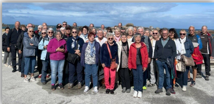
Le premier groupe en séjour à Mûr-de-Bretagne