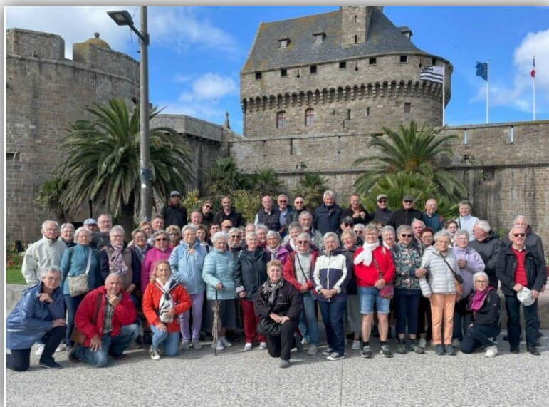
Le deuxième groupe devant les remparts de Saint-Malo.