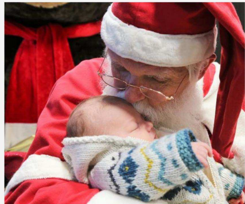
« Les gosses réclament juste de l'attention, je leur fais un bisou et je leur demande leur prénom », dit-il.