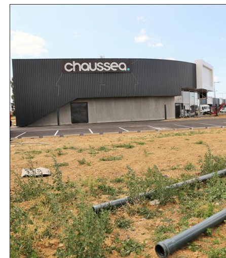
L'enseigne Chaussea va faire un saut de puce car elle était déjà implantée sur la zone Oasis de Pusey.