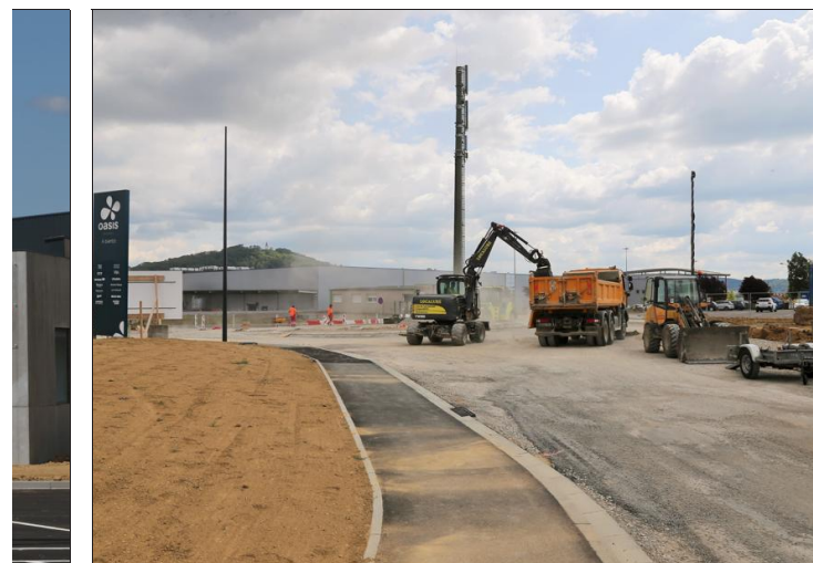
Les engins de chantier s'activent, ces dernières semaines, pour réaliser les dernières finitions.