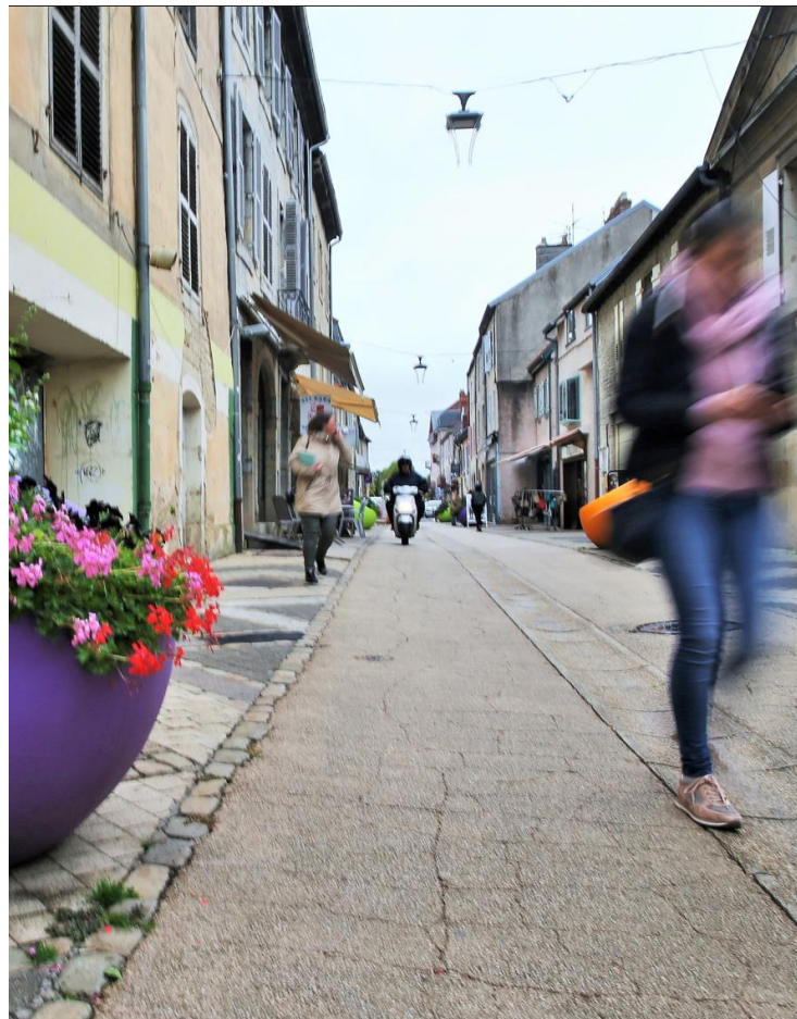
Plus que le lancement d'Oasis 3, ce qui semble davantage inquiéter les commerçants vesouliens en ce moment, ce sont surtout les cellules qui se vident en centre-ville.