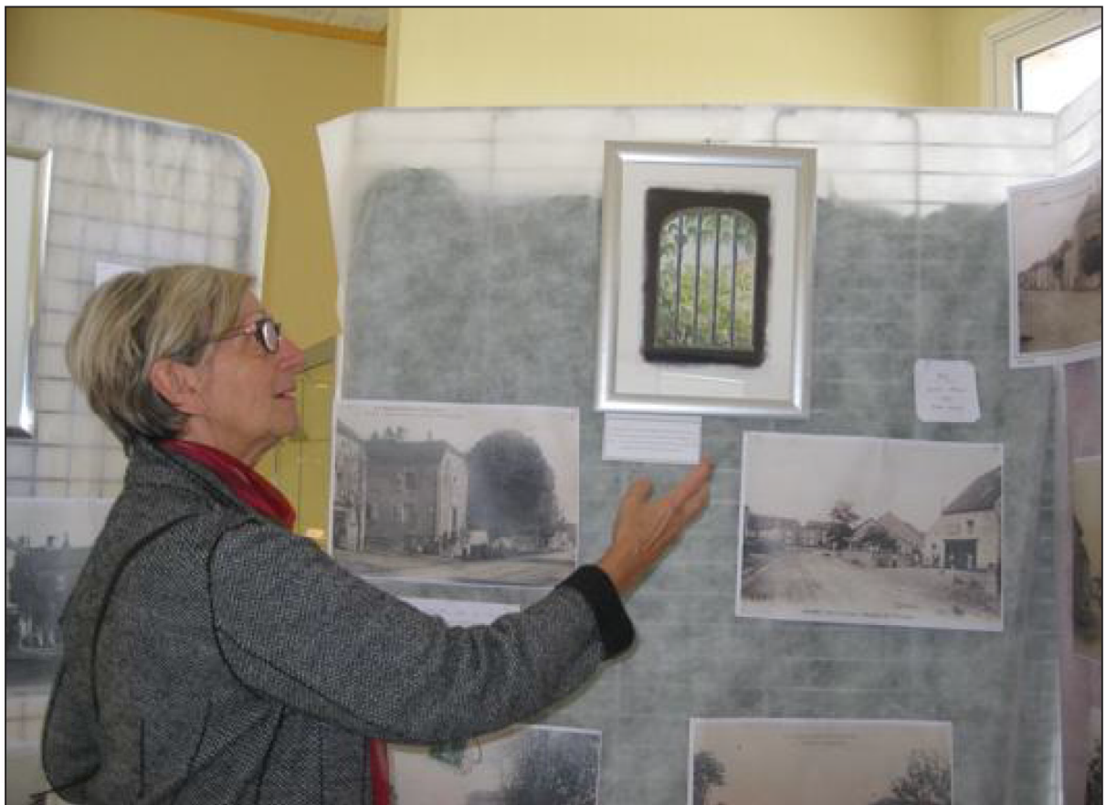
■ Une visiteuse conquise.