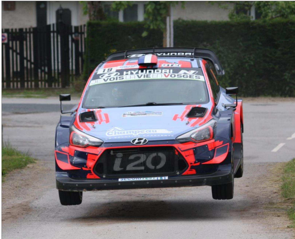
Sébastien Loeb, ici au rallye Vosges Grand Est en juin dernier, sera l'invité vedette du Vesoul Mecanic Show.

Entouré de champions sur deux ou quatre roues, à l'image de Vincent Philippe, Sébastien Loeb sera la grande attraction du Vesoul Mecanic Show. Sur la piste du circuit de la Vallée à Pusey, l'Alsacien effectuera des baptêmes avec sa Hyundai i20 WRC et exposera notamment sa 208 T16 de Pikes Pike.